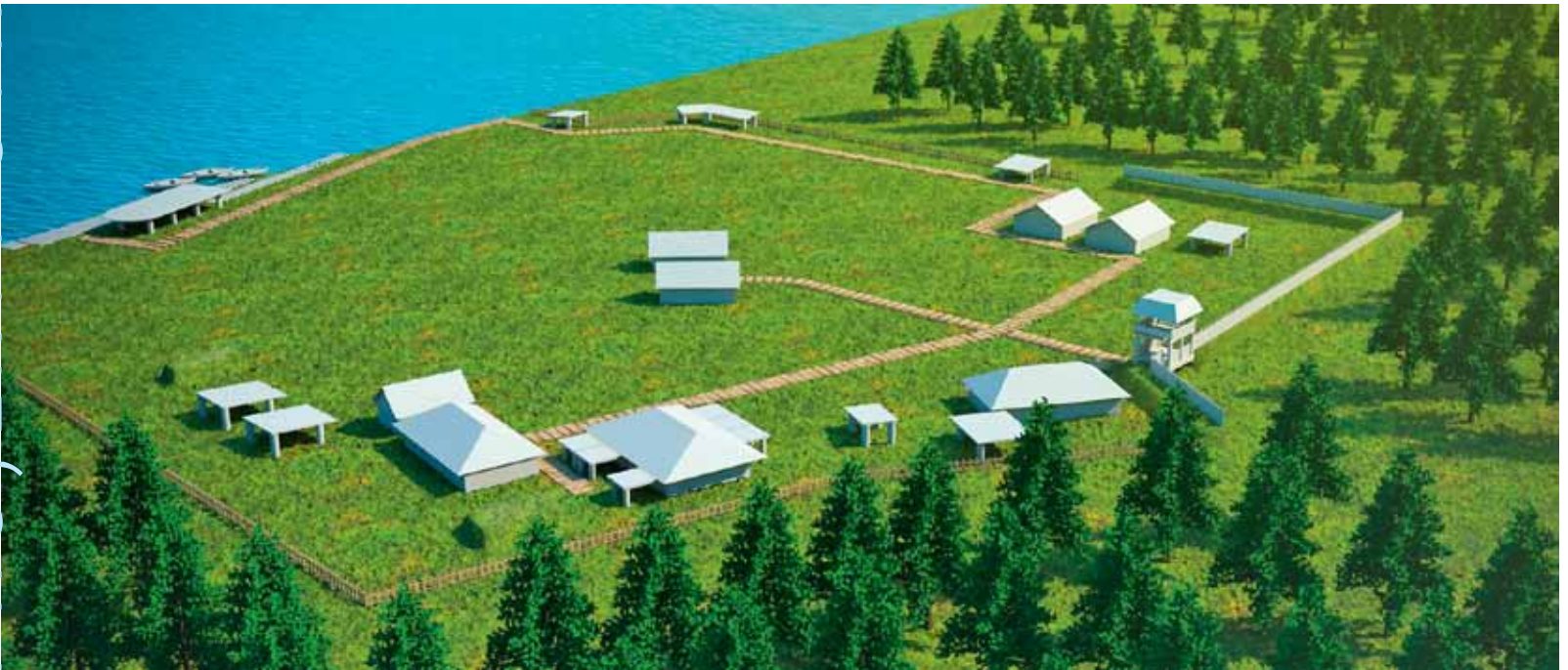
Fragment wizualizacji koncepcji Budowy Historycznej Ścieżki Edukacyjnej w Budzistowie • TERMIN REALIZACJI: 1.06 2017–31.12.2018 • SZACOWANY KOSZT: ponad 4 mln zł, w ramach RPO Województwa Zachodniopomorskiego 2014-2020, działanie 4.9 Rozwój zasobów endogenicznych