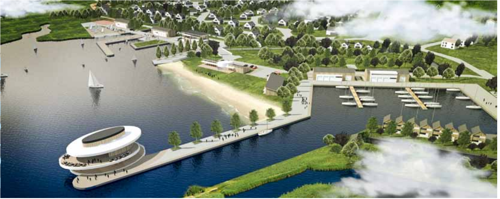
Konceptja zagospodarowania Jeziora Resko w Dźwirzynie • TERMIN REALIZACJI: 3.07 2017–31.12.2018 • SZACOWANY KOSZT: 11 mln zł, w tym 4,8 mln zł kwota dofinansowania w ramach RPO Województwa Zachodniopomorskiego 2014-2020, działanie 4.9 Rozwój zasobów endogenicznych